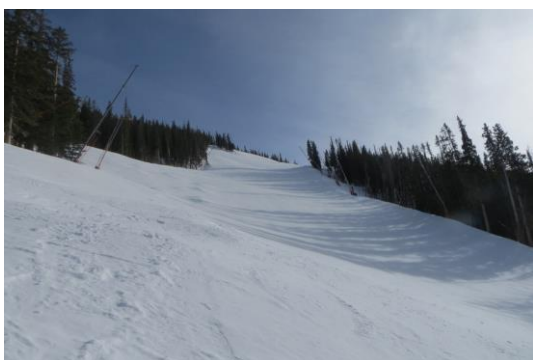
La partie la plus raide de la Birds of prey

La piste est exclusivement utilisée par les hommes, les femmes ne faisant jamais étape dans la station américaine. Le recordman de succès en Descente est le tout récent retraité Aksel Lund Svindal, vainqueur ici à quatre reprises. L'an passé, le Suisse Beat Feuz s'était imposé sur une descente raccourcie à cause des mauvaises conditions météorologiques.